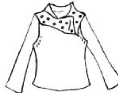
07-022 B 1575,-