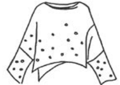
07-018 B 1875,-