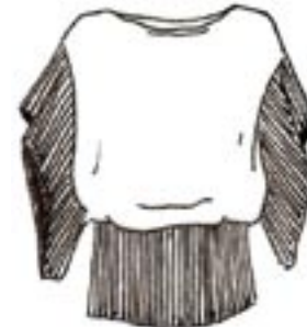
11-004 B 975,-