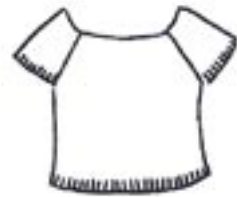
04-004 B 850,-