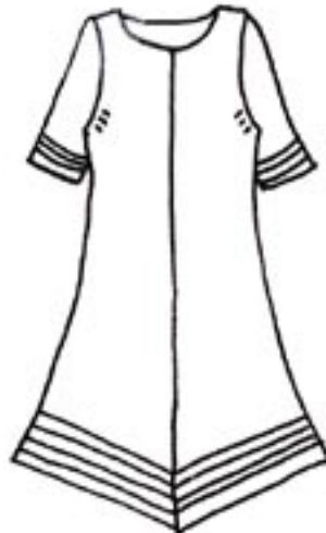
11-005 B 1750,-