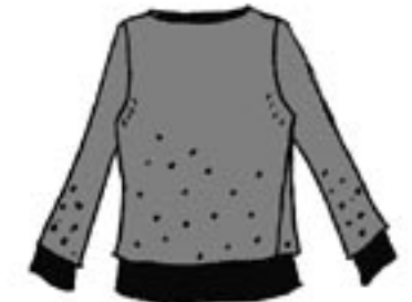
04-003 B = Natur/farve 04-013 B = Sort/farve 04-303 B = Farve/natur 04-313 B = Farve/sort