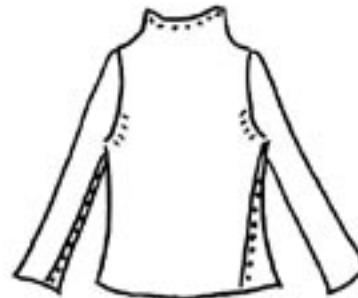
02-006 B 1275,-