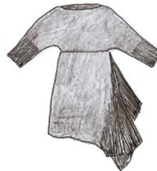
10-018 BS 1425,-