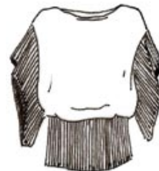
10-013 BS 975,-