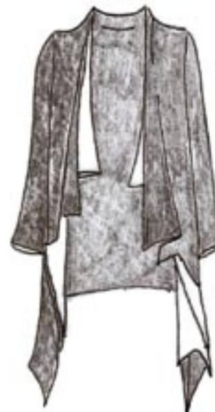
10-014 BS 2200,-