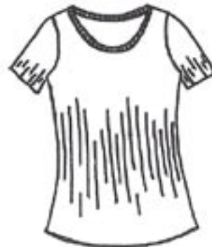
06-004 SB 650,- ej i espresso!