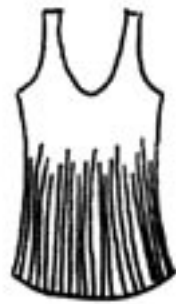
06-002 SB 450,-