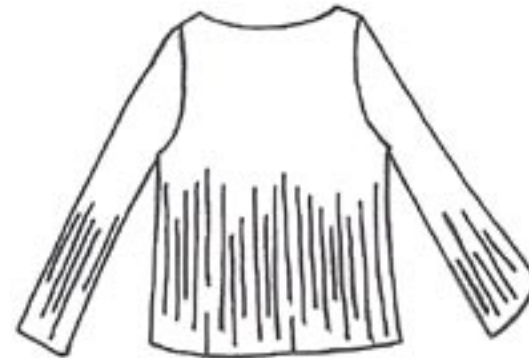
06-005 SB 875,- ej i espresso!