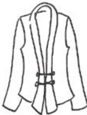
11-015 BS 1500,-