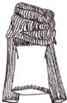
06-022 K 1500,-