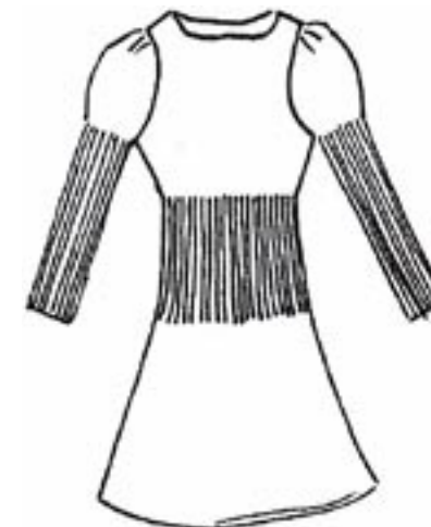
08-018 K 1675,-