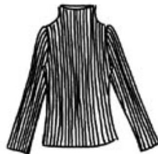
06-021 K 1275,-