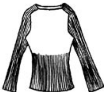
07-025 K 1375,-