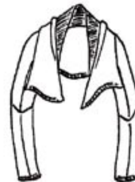
08-016 K 1125,-