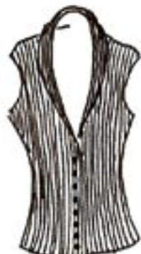
08-015 K 1375,-