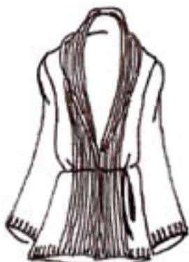
08-014 K 1625,-