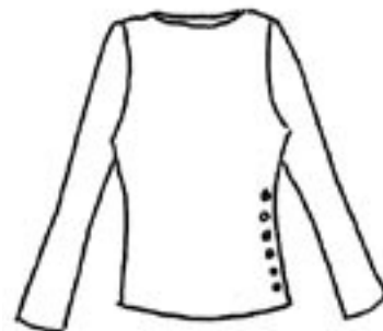
06-020 K 1375,-